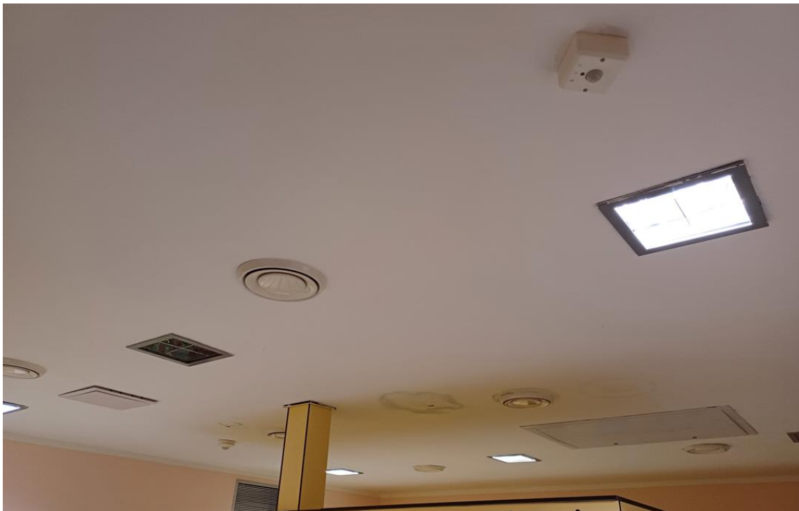
Obrázek 3 - strop šatny muži