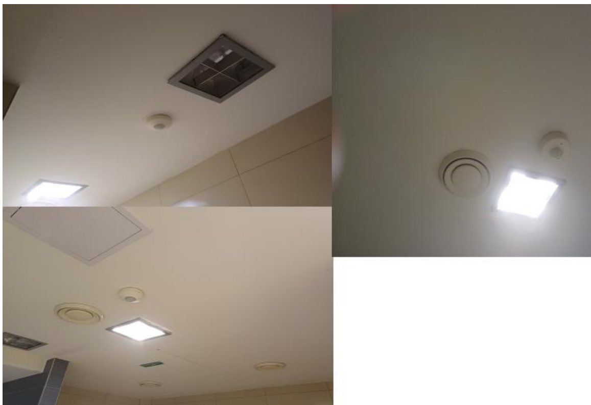
Obrázek 4 - Strop sprchy záchody