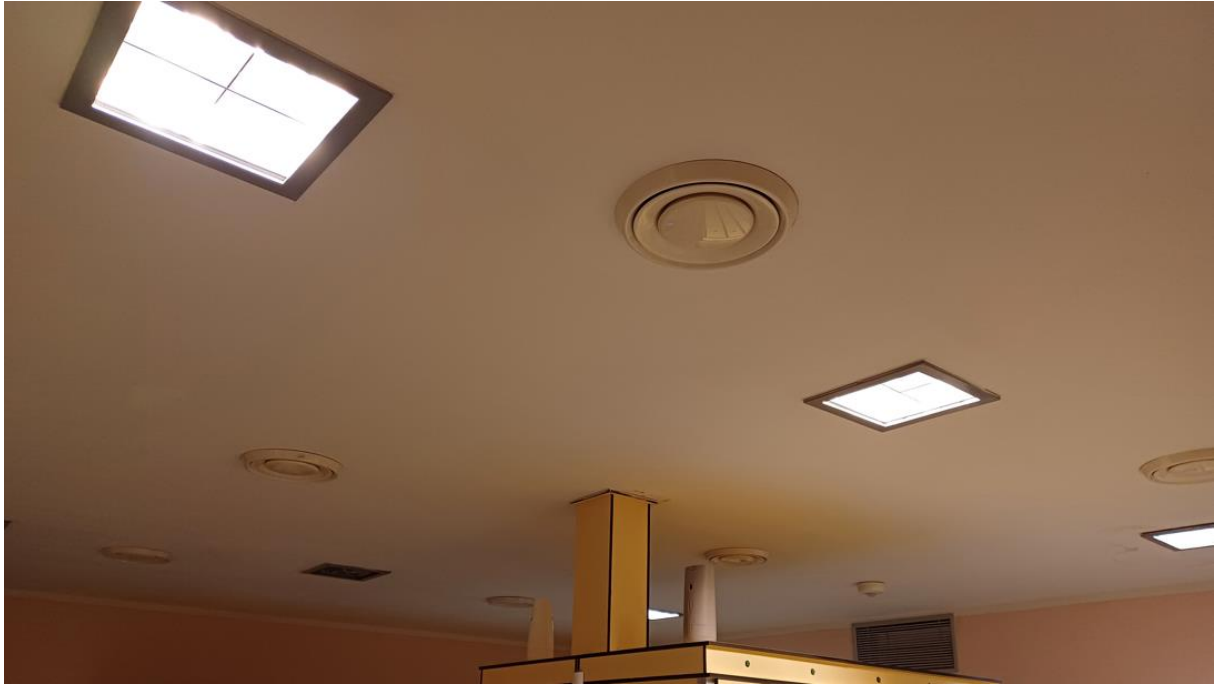
Obrázek 2 - strop šatny ženy