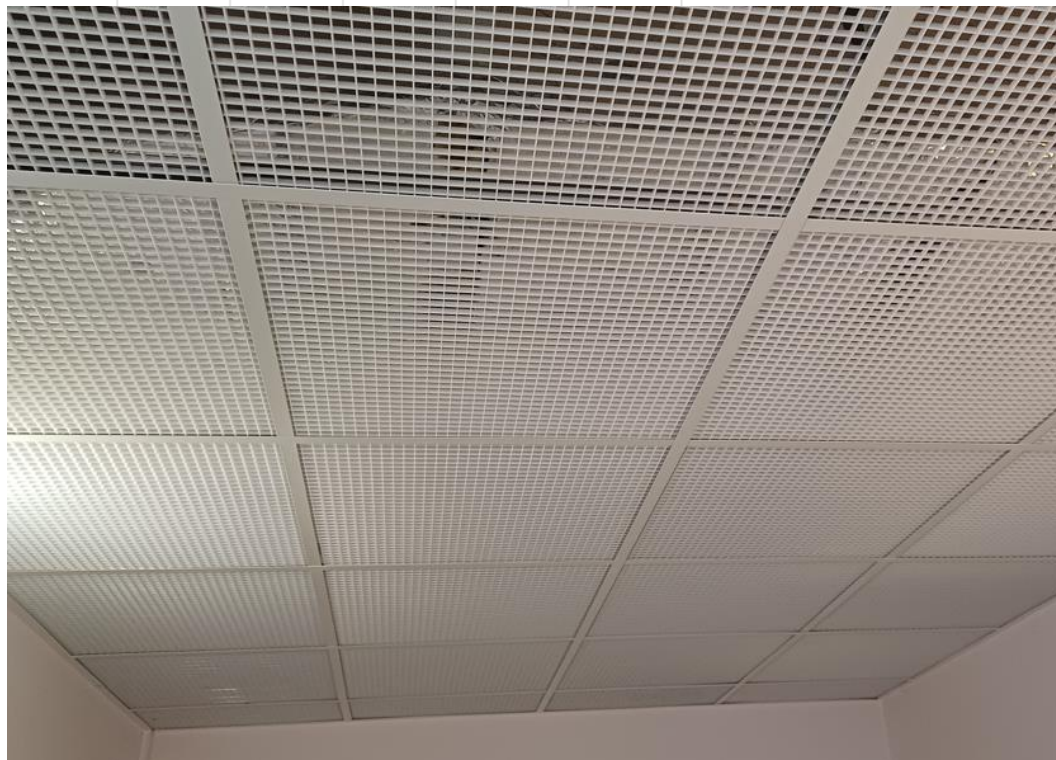
Obrázek 1 - vzor nového stropu